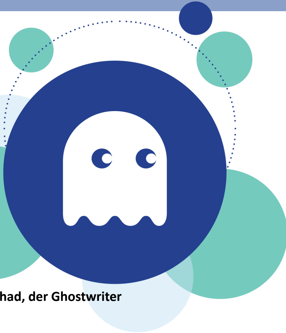
Chad, der Ghostwriter