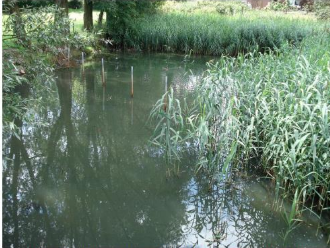
Abb. 2: Lebensraum der Schnecken: Uferbereiche eines Teiches, Aachener Str.

Abbildungen werden fortlaufend mit einer Unterschrift durchnummeriert, die Abbildungsnummer sowie die Erläuterungen bzw. die Quellenangabe von Abbildungen stehen unterhalb der Abbildung, Abbildungen müssen im Text zitiert werden.